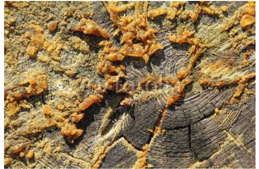
Resina di Pino