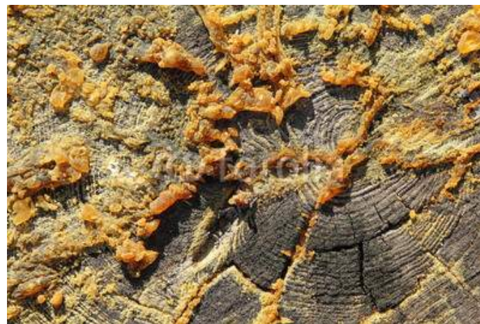
Resina di Pino