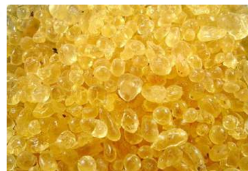
Resina di Lentisco/ Mastice